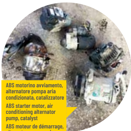
ABS motorino avviamento, alternatore pompa aria condizionata, catalizzatore ABS starter motor, air conditioning alternator pump, catalyst ABS moteur de démarrage, alternateur pompe air conditionnée, catalyseur