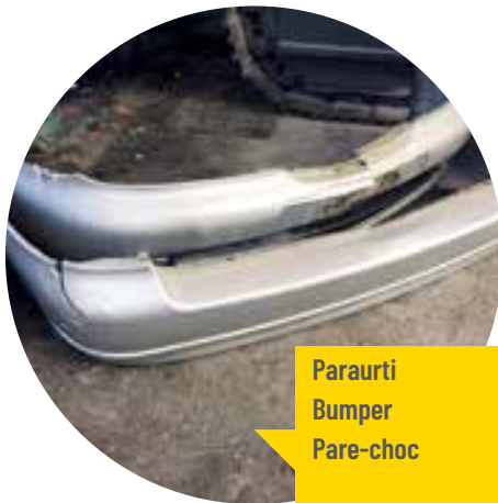
Paraurti Bumper Pare-choc