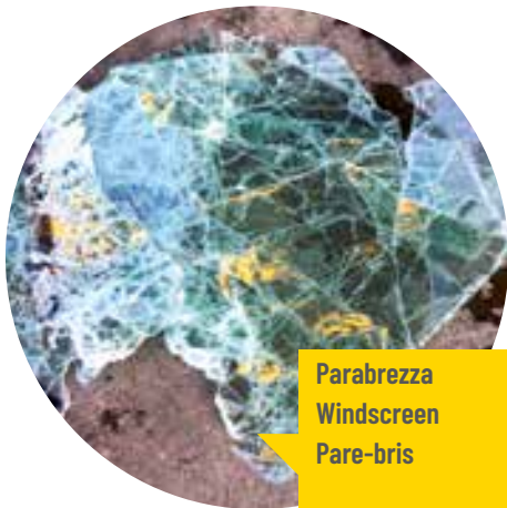
Parabrezza Windscreen Pare-bris