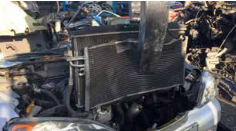
rimozione radiatore acqua e aria condizionata / water radiator and air conditioning removal / extraction radiateur eau et air conditionnée