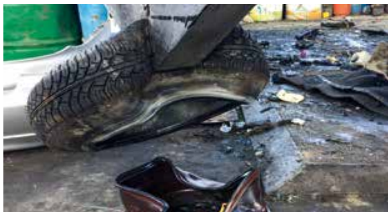
separazione pneumatici dal cerchio ruota / separation of tyres from the wheel rim / séparation des pneus de la jante