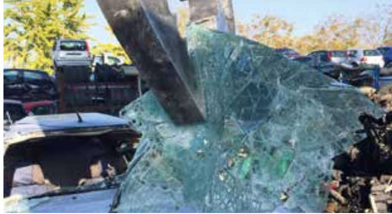
rimozione parabrezza / windscreen removal / extraction pare-brise