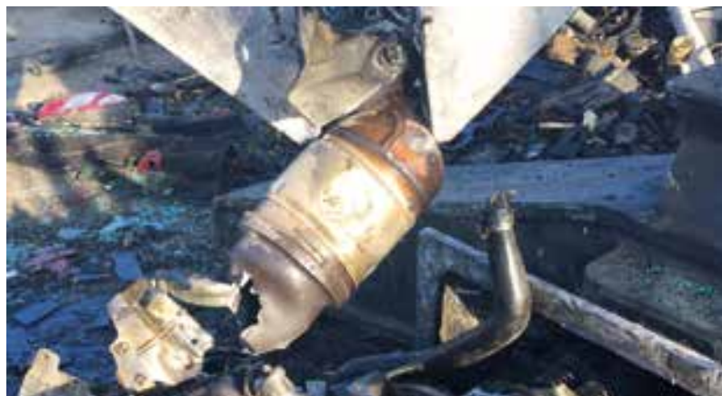
rimozione catalizzatore / catalyst removal / extraction catalyseur