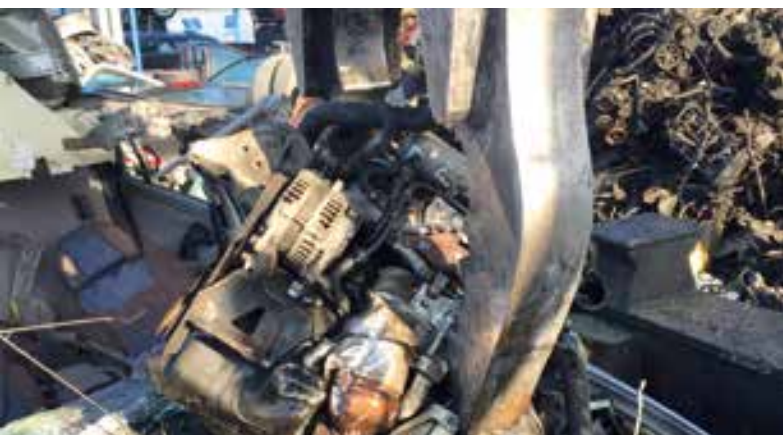
strappo motore / engine tearing / extraction du moteur