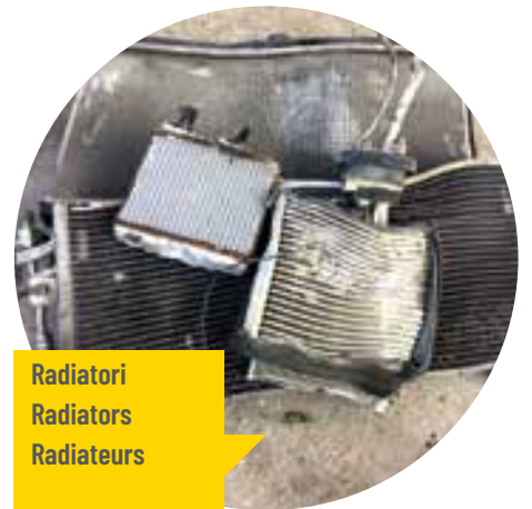
Radiatori Radiators Radiateurs