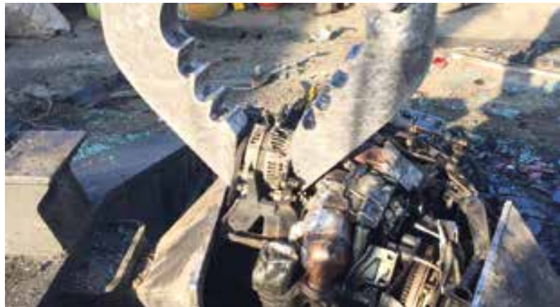
rimozione alternatore motorino avviamento e compressore aria condizionata / motor starter alternator and air conditioning compressor removal / extraction alternateur moteur de démarrage et compresseur d'air conditionnée