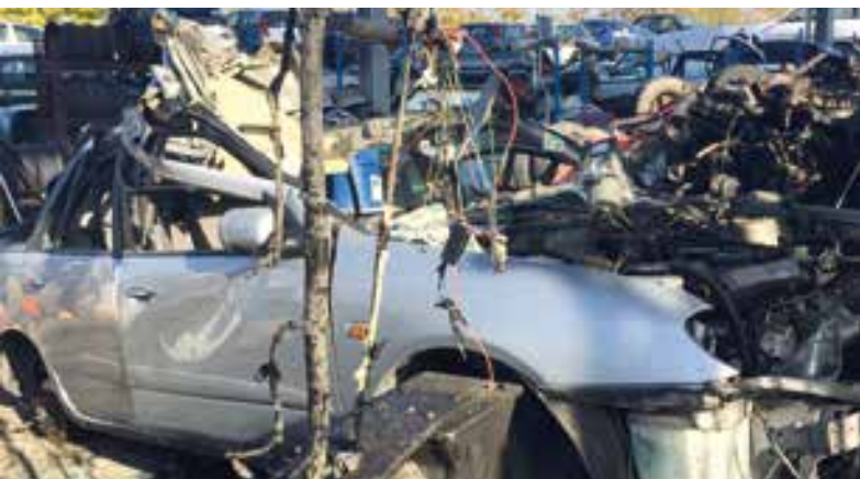
pulizia impianto elettrico da centraline varie / cleaning of electrical system from various control units / nettoyage système électrique de diverses unités