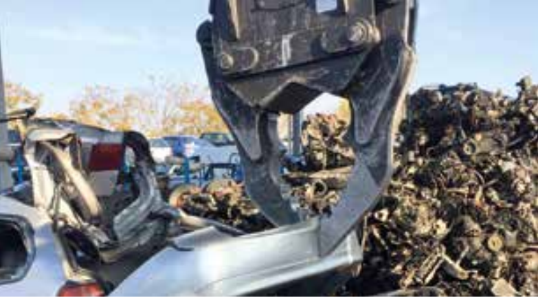
rimozione paraurti posteriore / rear bumper removal / extraction pare-choc arrière